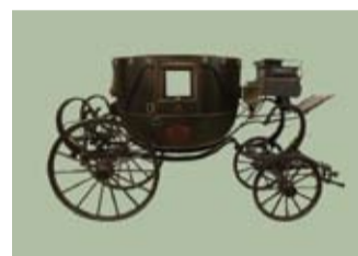
Museo della Carrozza